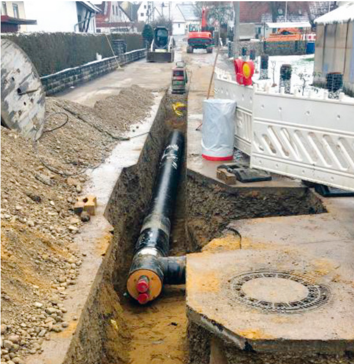
Die ersten Rohre der Nahwärmeleitung werden von GP Joule als Auftraggeber und Firma Femo als Auftragnehmer verlegt.

Sollten Sie noch offene Fragen zur Nahwärme generell haben oder sich für einen Anschluss interessieren, sind die Ansprechpartner von GP Joule jederzeit bereit, Ihnen weiter zu helfen.