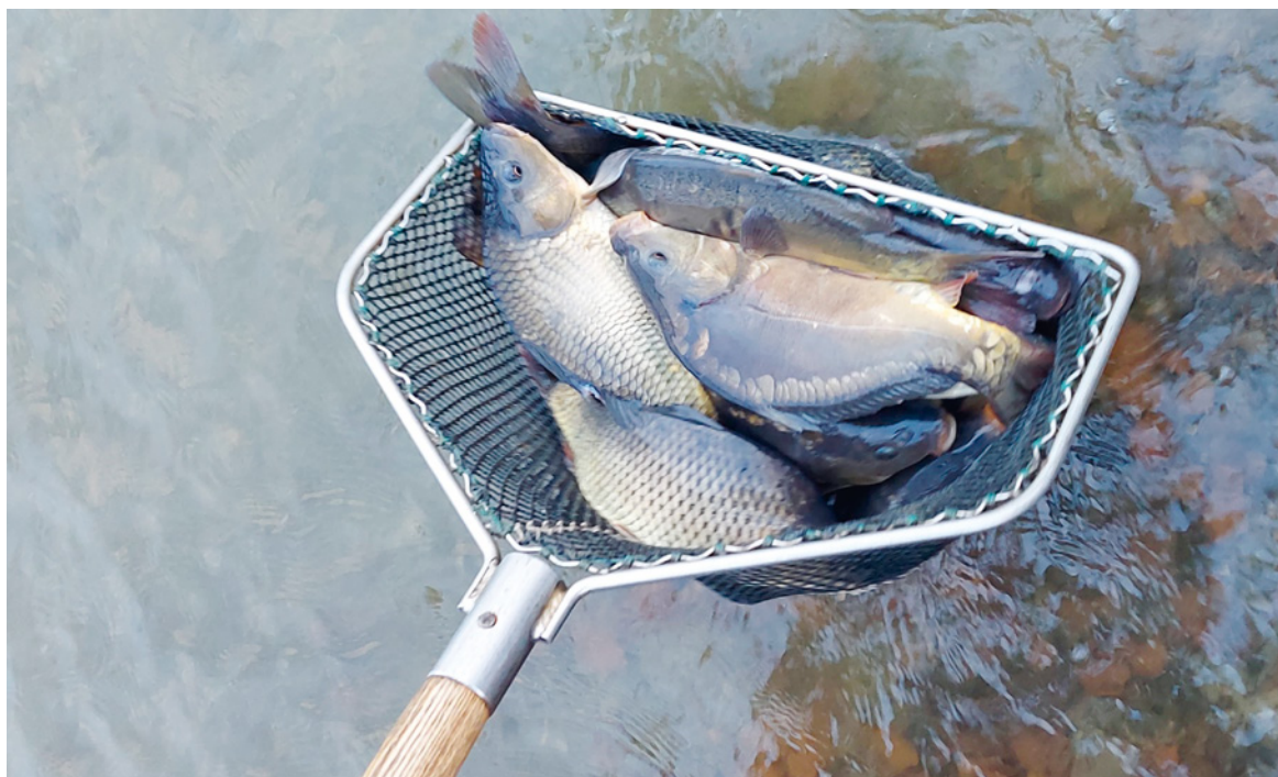
Ein Teil des Fischbesatzes 2020

Ab sofort können Sie unter Vorlage eines gültigen Fischereischeins im Rathaus Jahreserlaubnisscheine für das Fischen im gemeindlichen Baggersee erhalten. Die Kosten hierfür betragen 80,00 €.