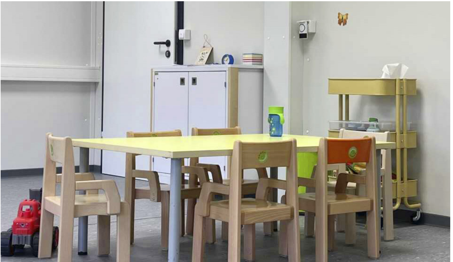
Einblick in den Gruppenraum