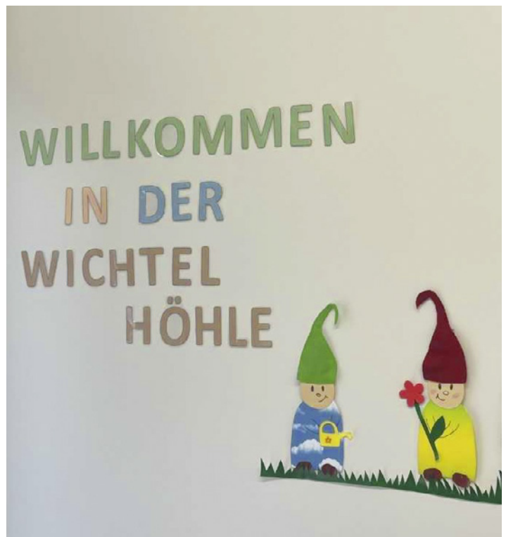
So werden die Eltern und Kinder in der Krippe begrüßt

Die Wichtel aus der Burg und aus der Höhle