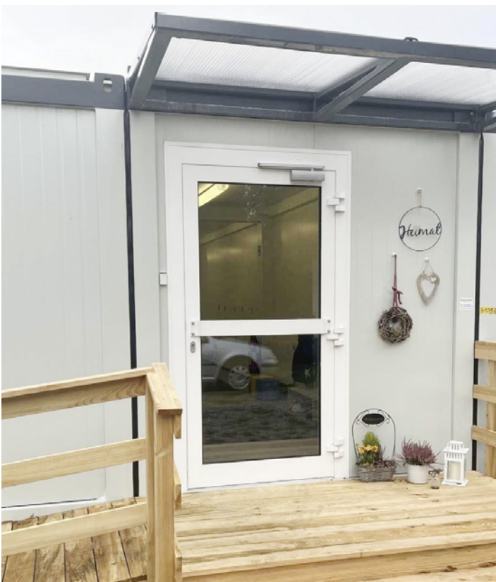
Der Eingangsbereich wurde barrierefrei gestaltet