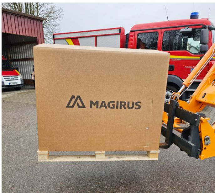
Anlieferung der neuen Tragkraftspritze

Die seit der Anschaffung des Feuerwehrfahrzeugs im Fahrzeug befindliche Tragkraftpumpe zeigte deutliche Alterserscheinungen. Nach Abwägung über die anstehenden Kosten von Reparatur und Neubeschaffung entschied sich der Gemeinderat unter Inanspruchnahme einer Förderung für die Beschaffung einer neuen Tragkraftspritze. Diese wurde geliefert und ist bereits auf dem Fahrzeug verbaut. Wir wünschen der Aktiven Wehr nun weiterhin gute Übungen und keinen Einsatz im Ernstfall mit einem neuen Herzstück auf dem Fahrzeug.