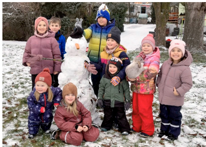
Kinder verschiedener Familien nutzen den damals spärlich liegenden Schnee zum Bau eines Schneemanns

Während die Erwachsenen oftmals über den Schneefall klagen, freuen sich Kinder und nutzen den teils auch wenig vorhandenen Schnee, um sich im Freien zu vergnügen.