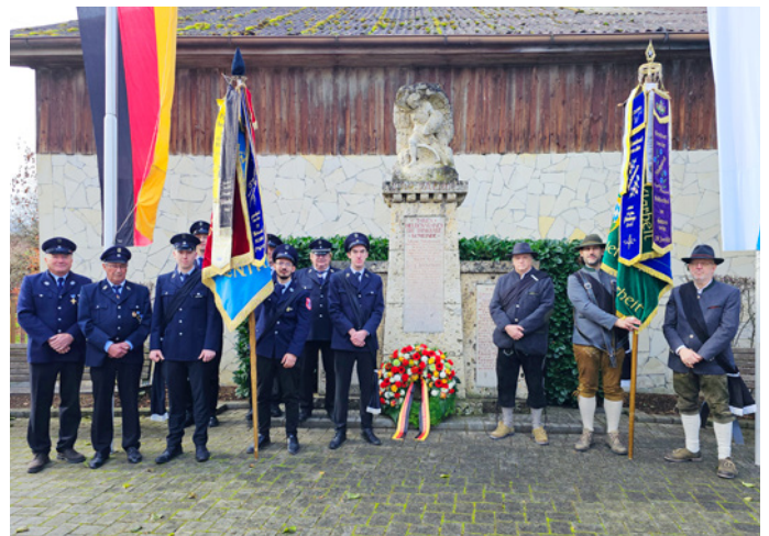
Begehung des Volkstrauertags am Kriegerdenkmal in Kühlenenthal

Die Gemeinde bedankt sich auf diesem Wege bei den Fahnenabordnungen der Vereine, die durch ihre Teilnahme an diesem wichtigen Ereignis einen würdigen Rahmen bilden.