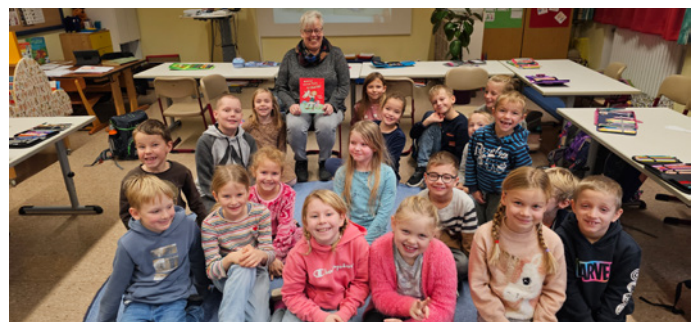
Vorlesetag an der Grundschule Westendorf

allen Schülern ein Landkreis-Buch, welches bestens in den Schulalltag integriert werden kann.