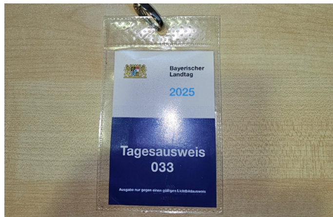
■ Besucherausweis des Bayerischen Landtags

Insgesamt hat der Freistaat Bayern diese Maßnahme mit 1.123.200,00 € bezuschusst; von der Gemeinde wurde ein Anteil von 124.800,00 € geleistet.